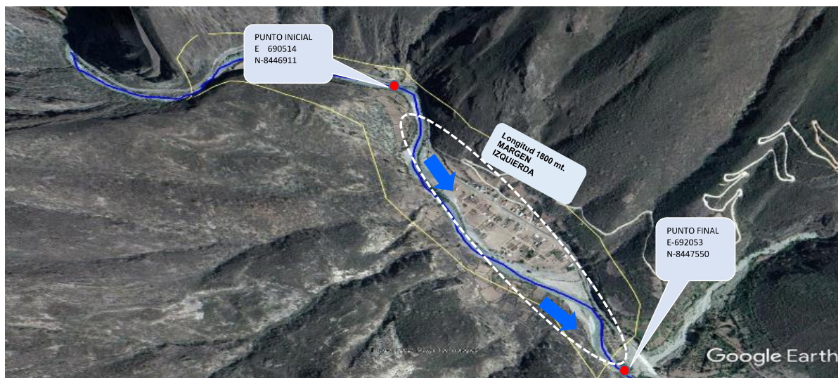
5.- IMAGEN SATELITAL DE ZONA VULNERABLE